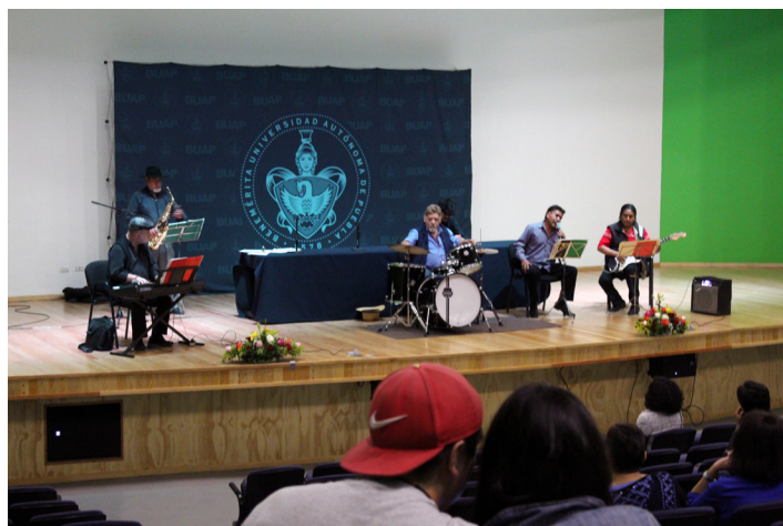
Cierre del evento.

Agradecemos a la Facultad de Ciencias Químicas de la BUAP por el apoyo en la organización y difusión del evento, así como al patrocinio de los Coffee break y de los regalos para los plenaristas.